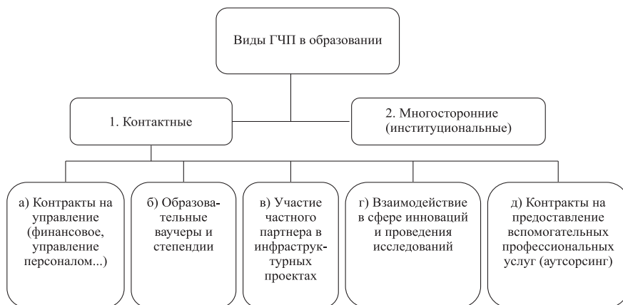
Рис. 2. Классификация видов ГЧП в образовании за рубежом

В процессе проведения исследования была создана классификация, которая наиболее полно отражает весь спектр видов и механизмов ГЧП в образовании, реализующихся на сегодняшний момент времени. Представленная типология составлена на базе результатов исследований ряда авторов [5; 8; 11; 13], отражая комплекс подходов разных специалистов в классифицировании типов ГЧП в образовании за пределами РФ (рис. 2).