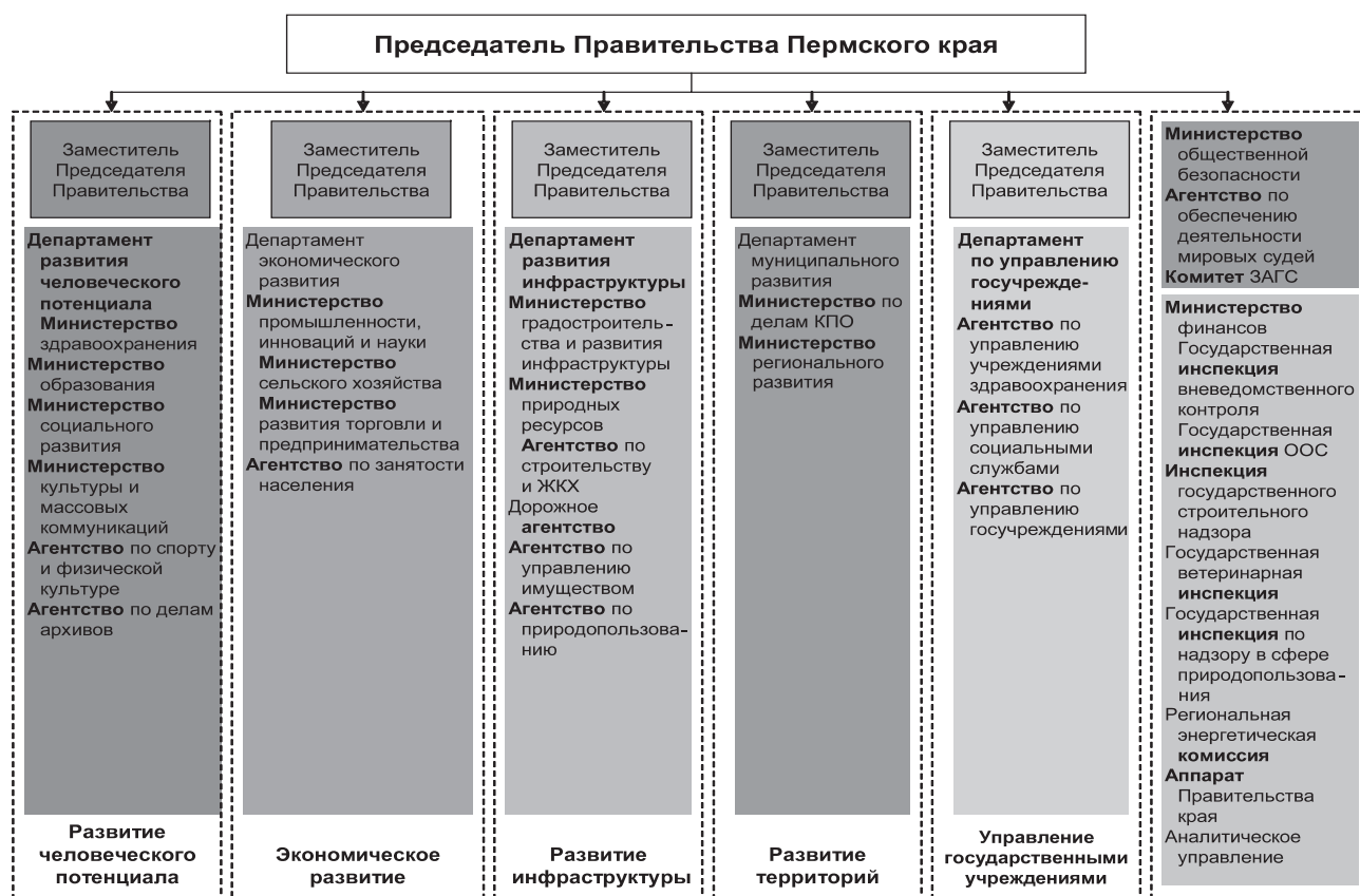
Рис. 2. Структура Правительства Пермского края.

Аналогичный подход к разделению управленческих функций и реализации государственных полномочий был принят и на уровне Пермского края (рис.2).