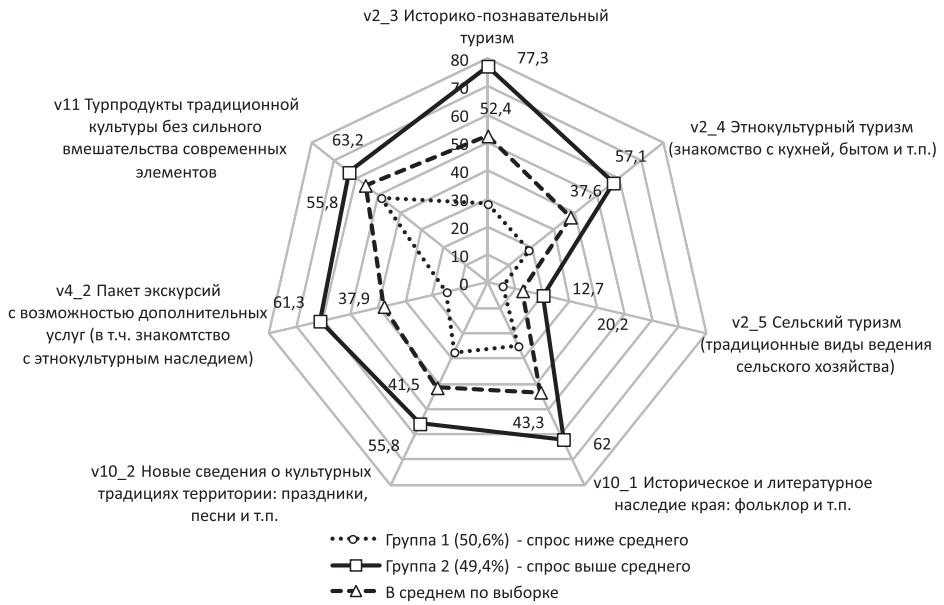
Рис. 3. Привлекательность этнокультурного туризма в целом (фактор F3), % от числа респондентов в группе / Fig. 3. Tourist demand for ethnocultural tourism in general (factor F3), % of the number of respondents in the group