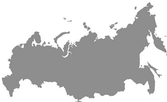
Рис. 1. Демонстрируемая на фокус-группе схематическая карта России

Наиболее обсуждаемым стал вопрос о соотношении «имперских» и «советских» элементов официальной символики, который перешел в плоскость видения истории и наследия двух эпох. Прослеживается отторжение и той, и другой систем символов «прошлого» (заметно не коррелирует с возрастом участников): «нужно убрать какие-то имперские символы, Россия ведь демократическое государство» ; «к советским символам по-разному отношение складывается, я вижу в них негатив» , и проч.