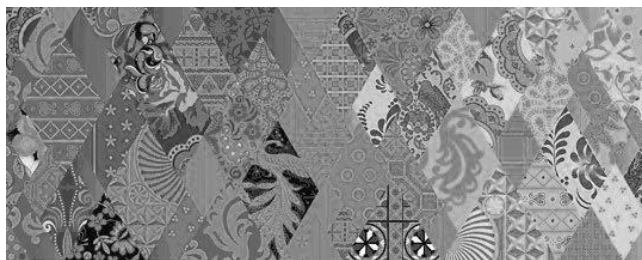
Рис. 2. Демонстрируемое на фокус-группе олимпийское лоскутное одеяло (элемент визуального образа Сочи-2014)

Обсуждение перечня символов показал некоторые существенные тенденции в видении обществом «себя». Проводя аналогии с медведем как традиционным символом, респонденты отмечали как «добродушие», так и «ярость». Хотя ярко заметен тот факт, что «медведь» переходит из плоскости идентификации с Россией в политизированную плоскость, однозначно воспринимаемая как логотип политической партии «Единой России», и приобретает специфичный оттенок восприятия.