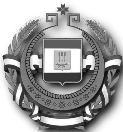
Рис. 3. Герб Республики Мордовия